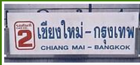
Nachtzug von Chiang Mai nach Bangkok