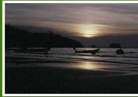
Sonnenuntergang Nai Yang