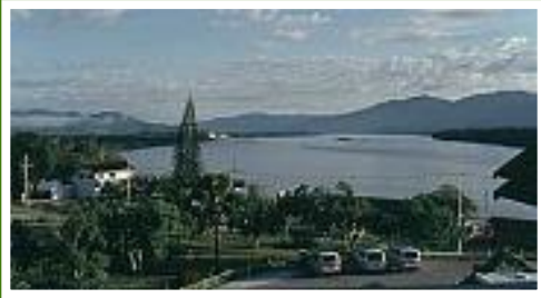
Blick über den Mekong nach Laos und Myanmar