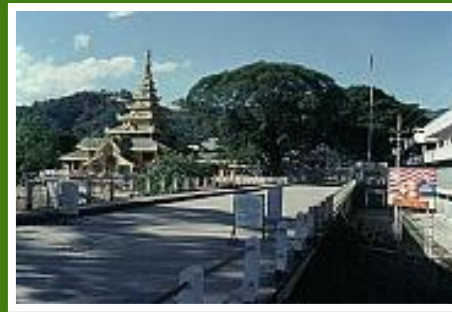
Mae Sai und die Grenzbrücke zu Burma