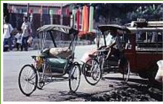
... Warten auf Kunden