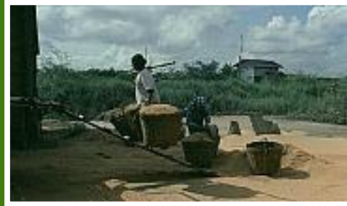
und beim weiterverarbeiten