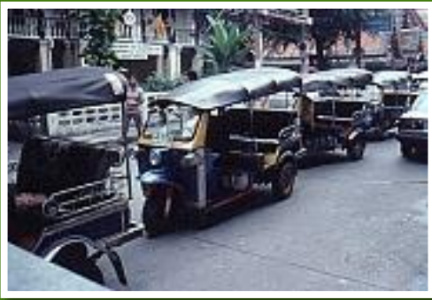
Tuk Tuk in Bangkok