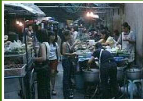
Garküchen auf dem Nachtmarkt in Patpong