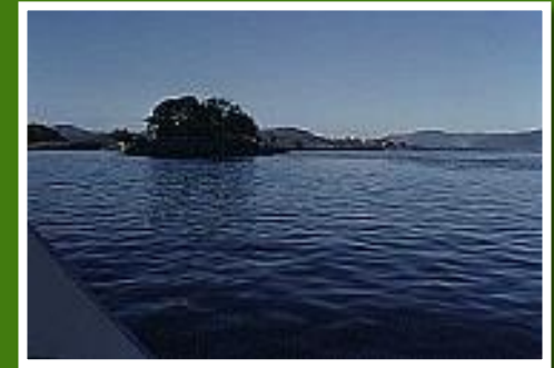
Goldenes Dreieck vom Boot aus