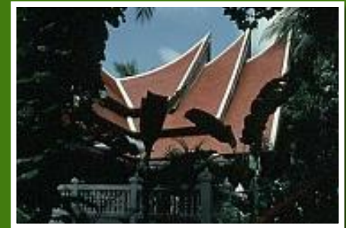
Hotel Marina Cottage auf Phuket