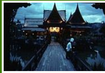
Hotel Pearl Village auf Phuket