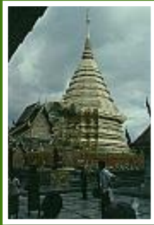
Lamphun Wat Phrathat Haripunchai