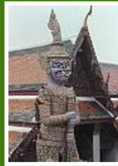
Tempelwächter beim Wat Phra Kaeo