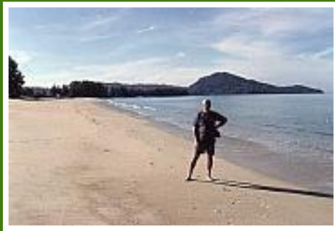
Kilometerlange Sandstrände am Nai Yang Beach