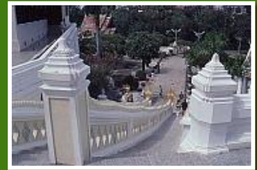
Saraburi Phra Buddha Tempel