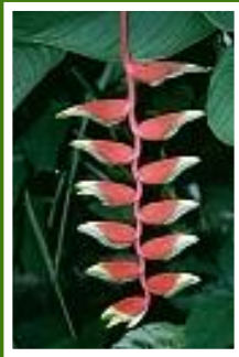
Exotik im Hotelgarten