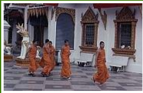
Mönche bei Chang Mai