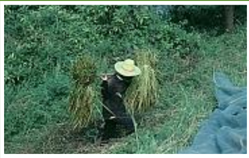
Reisbauer beim ernten