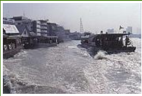
Pulsierendes Leben auf dem Chao Phraya