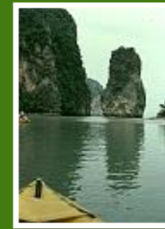
Kanuexursion bei Phang Nga