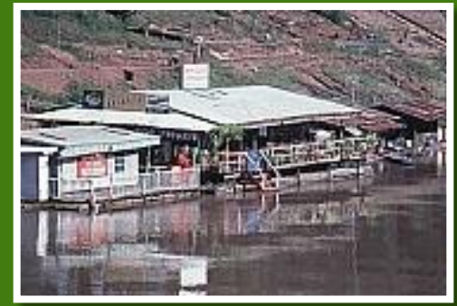
Ayutthaya – leben am Fluss