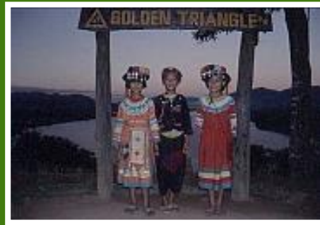
Posieren am goldenen Dreieck