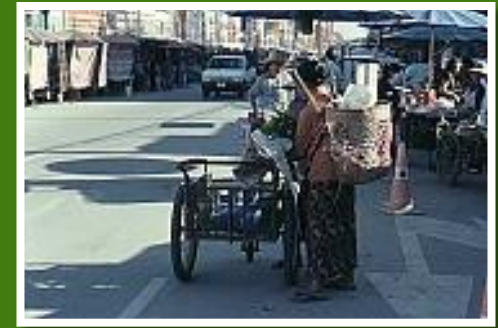
Mae Sai Markt